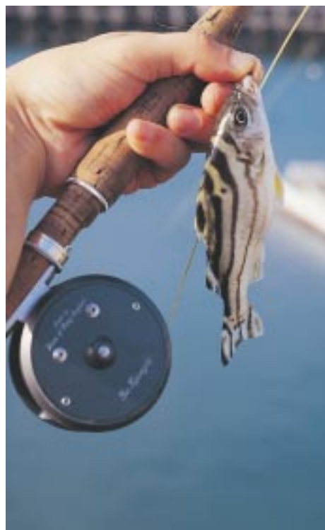
花身雞魚則是河口、淺灘常見的小型對象魚。

以毛鉤作為垂釣技術，歷史相當久遠，且在世界各地均有類似模式。經推測乃是遠古之人發現晨昏時，水面便有魚兒躍身捕食昆蟲，但苦於無法將小蟲置於鉤上並飄浮水表，才有聰明之人將狩獵來的飛禽走獸毛料綁在魚鉤，藉以欺騙水中魚兒，而這便是毛鉤的濫觴。