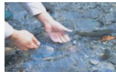
當垂釣完畢後，釋放多餘或不願攜帶的漁獲，是西式毛鉤愛惜自然資源與尊重生命的態度與觀念。

簡單地說，西式毛鉤帶給人們的樂趣，已非人類過去見獵心喜的原始本性，而是在深刻體認自然後，用一顆滌淨的心去看人類所存在的大自然，並以相互的交心，得到當中的感動！