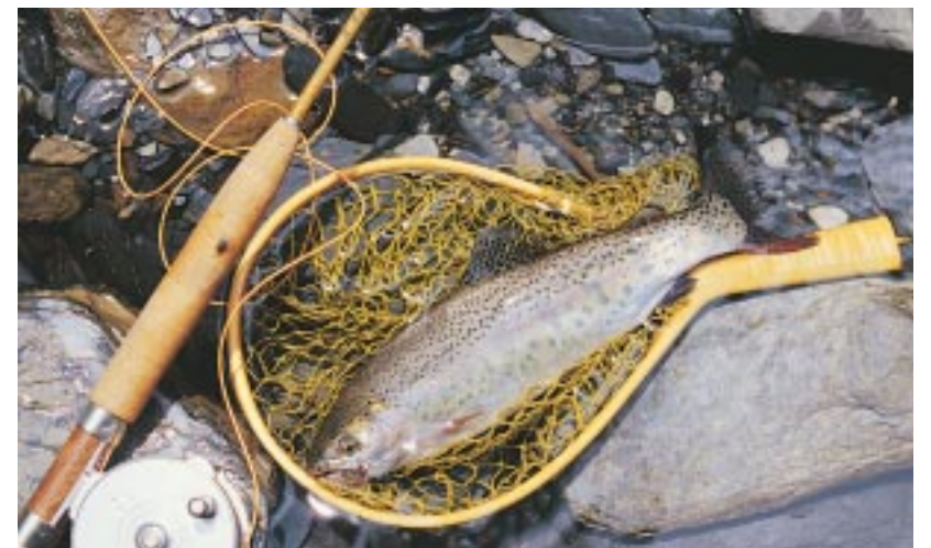
野生虹鱒充滿野性的魅力！