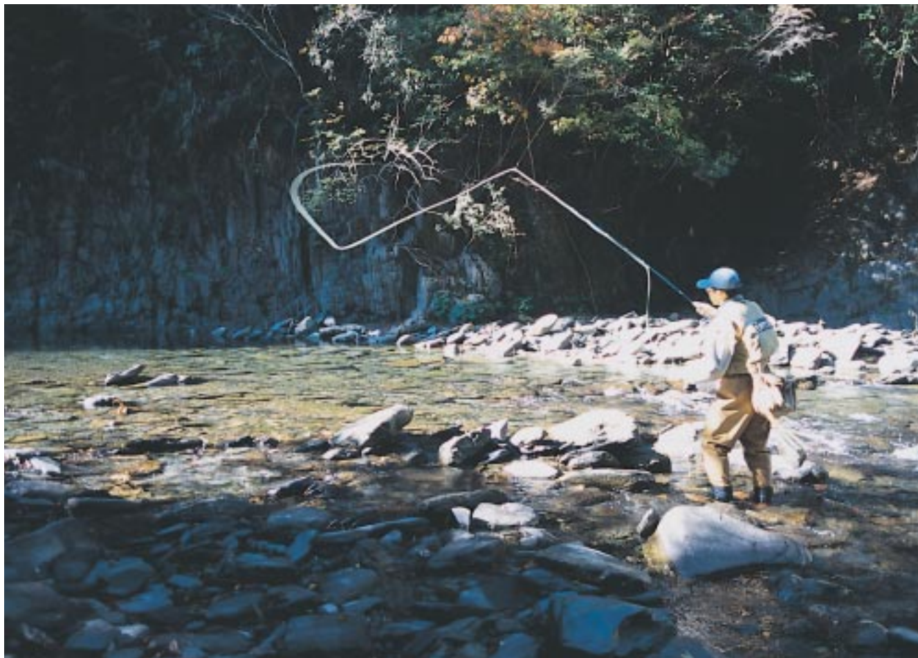
西式毛鉤最早的發源便是以溪釣鱒魚為主