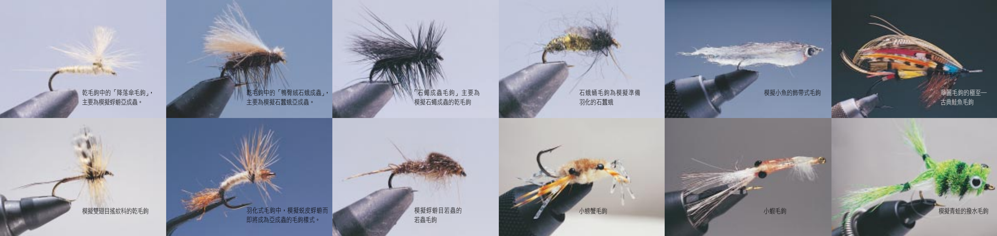
乾毛鉤中的「降落傘毛鉤」，主要為模擬蜉蝣亞成蟲。