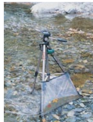
利用置性捕蟲網採集羽化中的水棲昆蟲，作為選擇毛鉤的依據。