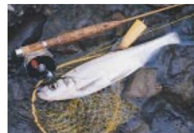
紅鱒鮭魚則釋河流、湖泊、水庫的常見對象魚。

至於西式毛鉤的美感，除前面提及的之外，也頗適合全家大小、男女老少，並藉由推廣它，來提倡全民戶外活動及環保紮根的工作，故西式毛鉤釣法實在是相當好的休閒運動。