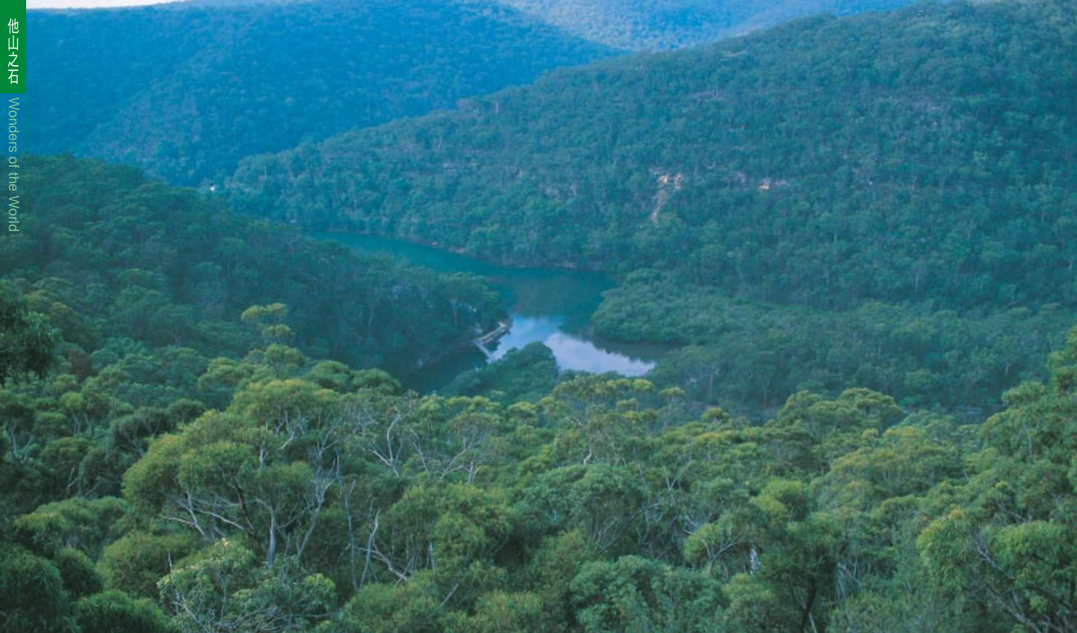
站在觀景台可以眺望保護區