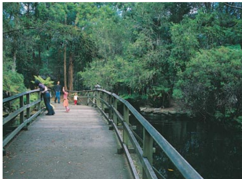
小橋流水野鴨，是園區內令一派悠閒。

此站設計為讓遊客可以親近鳥類，所以放置了一個餵食台，餵食台旁立了一個大型鳥類圖鑑，因為鳥類停留吃食物是逢機性的，所以遊客就可視當時狀況對照大型圖鑑，這樣就可以知道鳥的名字了。這個設計看似簡單，但傳達了一個重要訊息——「生物出現是逢機的」，所以若想多賞鳥的人，就必須常來這裡駐足觀察，或許每次都有不同的體驗。