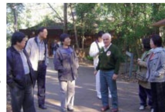
國家公園裡的解說員細心的 為我們解說保護區裡的每一項設施