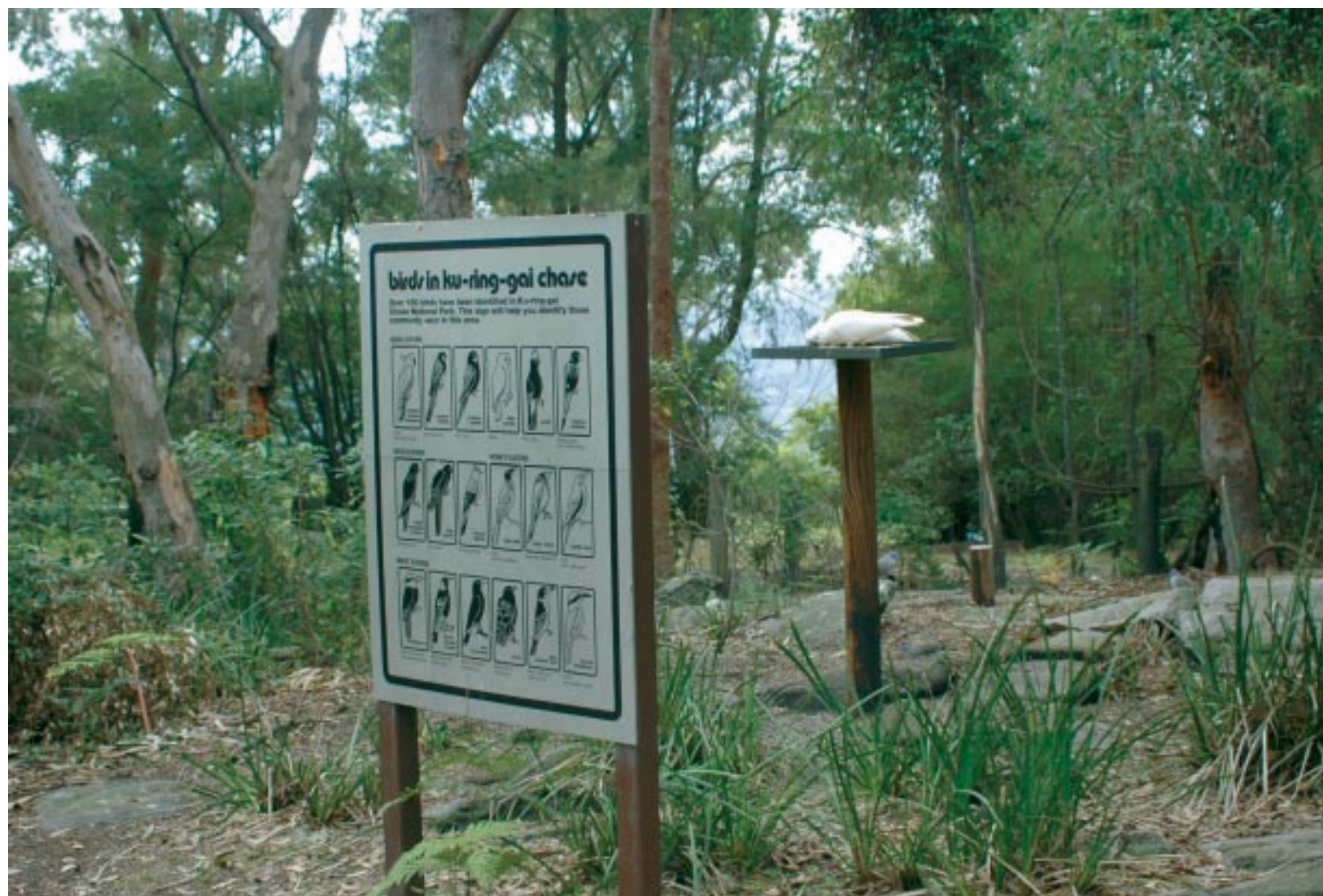
完善的解說設施，可以讓遊客隨時比對得知正確物種名稱。