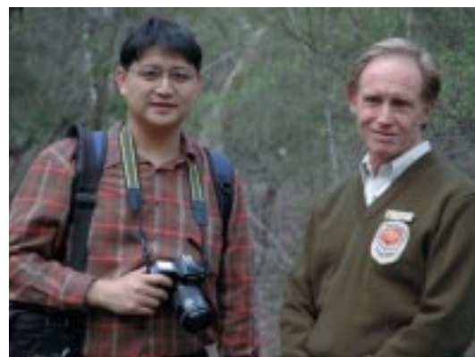
難得飛到雪梨，我和園內的自然環境解說員一見如故。