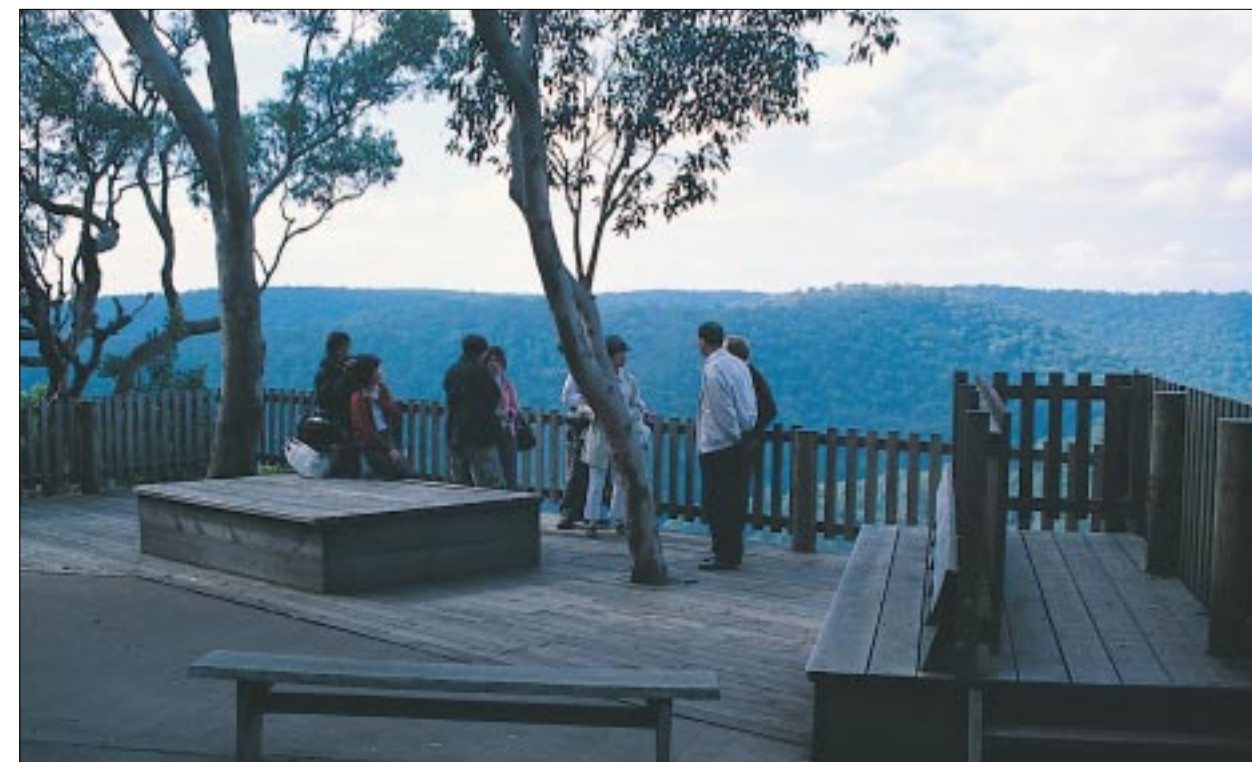
原木觀景台相融於自然環境中

此區主要是讓遊客居高臨下觀賞澳洲原始岩壁上的植群生態，綠色植被大部份都是木麻黃屬和尤加利屬的植物，所以遠遠看起來很壯觀。而觀景台是全部用木頭所組成，雖然沒有特別的設施，但原木的材質襯托當地的自然環境，真是絕妙的組合。