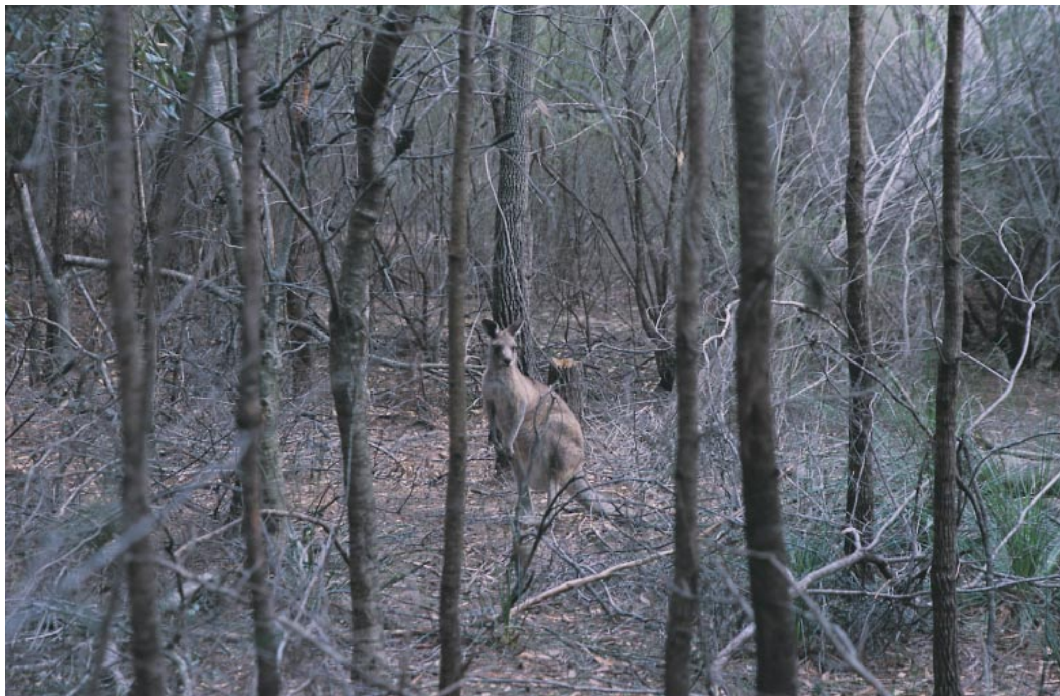
林木蕪鬱的林區是小動物們最好的家