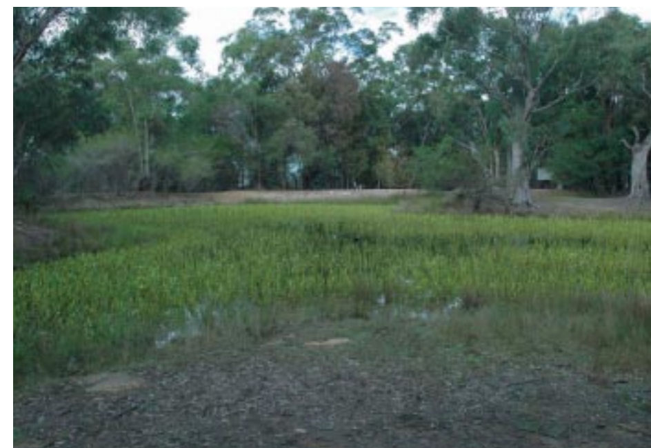
半人工化的沼澤濕地是鴨科的棲息地