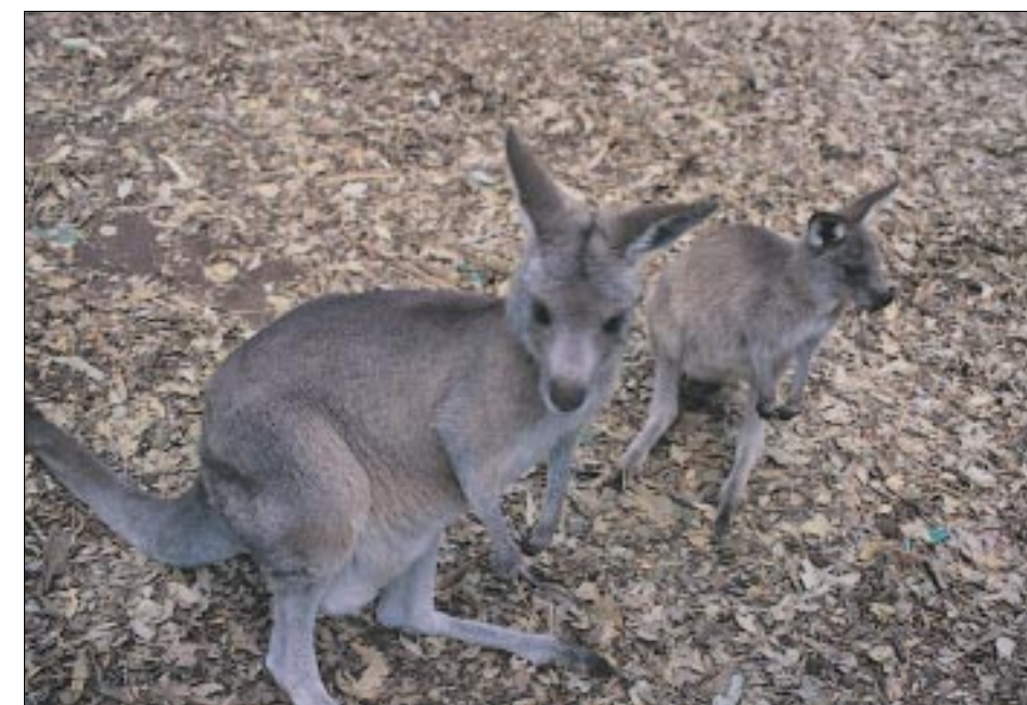
活潑亂跳的袋鼠看到遊客到來，紛紛跳出來Say Hello！

這區是專為遊客觀賞袋鼠所設置的區域，在這裡還看到一個有趣的解說牌寫著「不要踩在灰袋鼠晚餐上」，因為灰袋鼠都會到草原區吃地上的食物，所以園區就擬人化的設計了這解說牌，除了可以知道袋鼠會在這裡出現外，也間接介紹的袋鼠的食性，而且也深深傳達了愛護袋鼠的訊息。袋鼠是全世界最大的有袋動物，因為胚胎在袋中生長，而非在母親的子宮生長，所以是很特別的有袋哺乳動物。體重常可高達百公斤，堪稱是世界上獨一無二的動物，然而在這裡你可以很輕易的發現牠。