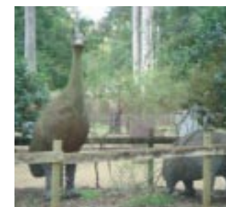
和駝鳥很像的鴛鳥

此區為展示澳洲特有鳥類——鴛鳥展示區，鴛鳥是世界上第二大的不會飛行的鳥，全世界也只有一種僅分佈於澳洲，因此也是相當難得的機會可以看到。不過很多遊客都把牠當作是駝鳥，下次當你造訪時，可得仔細瞧瞧到底牠跟駝鳥有何區別。