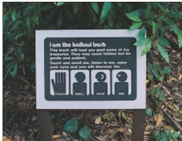
「眼、耳、鼻、手」齊到，是體驗的技巧。